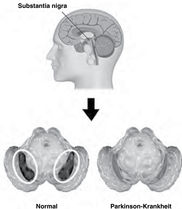
Abbildung 1.3. Die Substantia nigra (lateinisch für „schwarze Substanz“) bei Personen ohne und mit Parkinson-Krankheit. Bei der Parkinson-Krankheit ist die Substantia nigra eine der Schlüsselregionen im Gehirn, in der Zellen absterben.