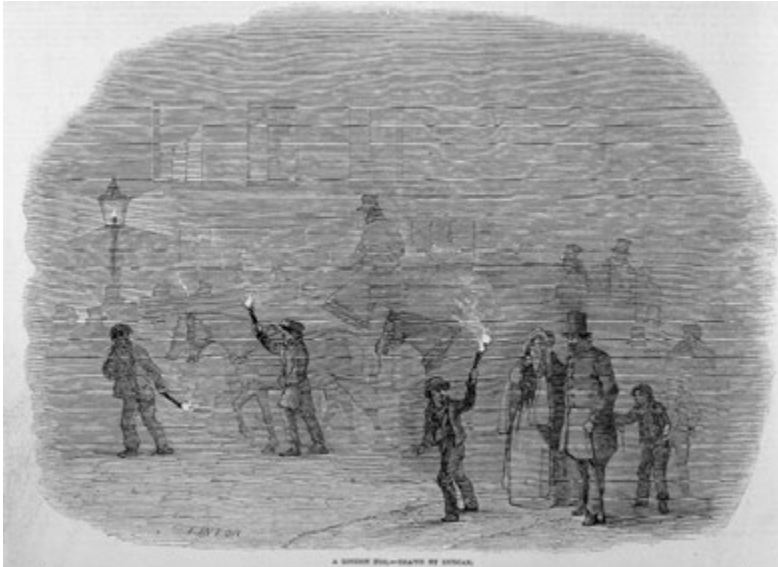
Abbildung 1.1. Darstellung des Londoner Nebels, 1847.

Einem Umweltforscher zufolge „ist es schwierig, das Ausmaß der Luftverschmutzung in London während des gesamten 19. Jahrhunderts vollständig zu erfassen.“ 4 Der von der Industrie herrührende Londoner Nebel (Abbildung 1.1) war „oft so dicht, dass er [...] die allgemeinen wirtschaftlichen Aktivitäten unterbrach und sogar dazu beitrug, dass [die Stadt] zum Nährboden für Kriminalität wurde.“ 5 Auf diesen dunstigen Straßen beobachtete ein erfahrener Arzt etwas ganz Neues.