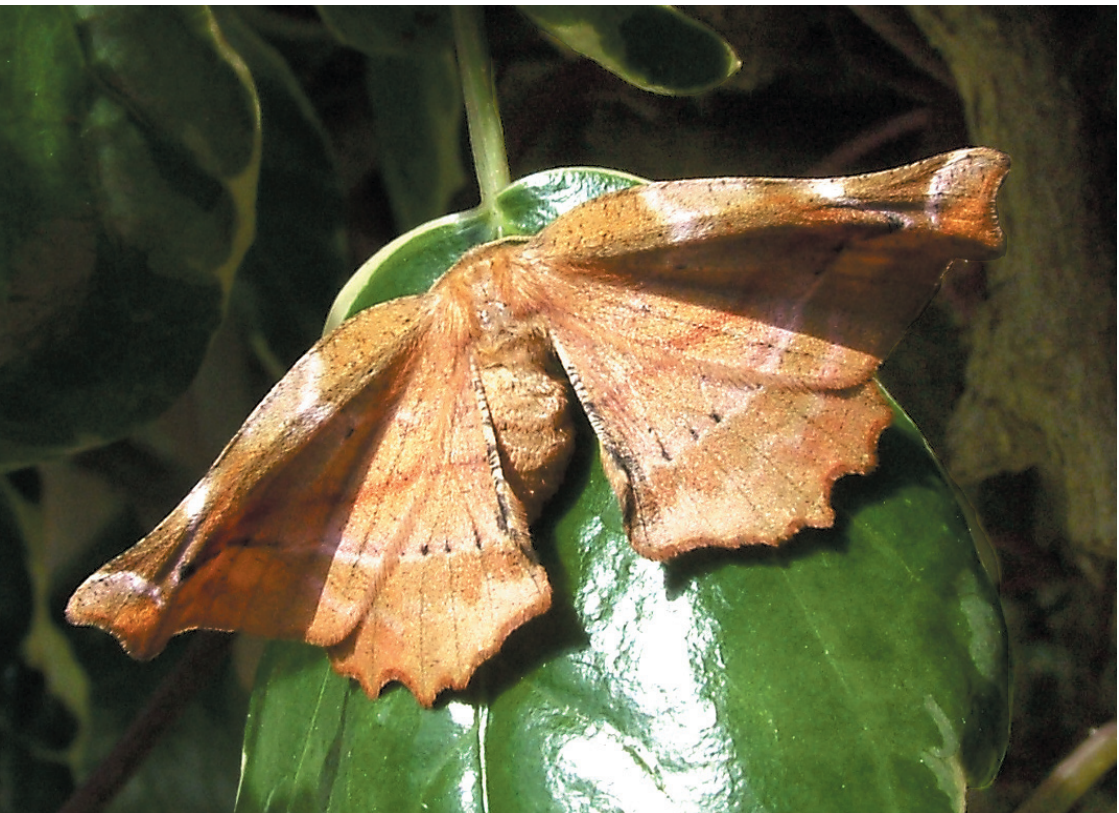
Apeira syringaria – Fliederspanner