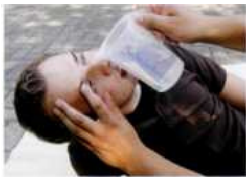
Abb. 13.2 Augenspülung: Das Auge am besten mit einem Tupfer offen halten. Die Spüllösung oder klares Wasser aus 10 cm Entfernung von innen nach außen laufen lassen. Werden Säuren, Laugen oder andere Chemikalien ausgespült, muss der Helfer zum Selbstschutz Handschuhe tragen. [FLA]

Ein Glaukom entwickelt sich meist über einen längeren Zeitraum. Bei einem akuten Glaukomanfall dagegen erhöht sich der Augeninnendruck plötzlich.