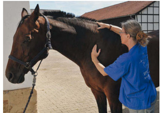
► Abb. 7.5 Mobilisation des zervikothorakalen Überganges links: Traktion nach kranio-lateral sowie Release des M. serratus ventralis cervicis.