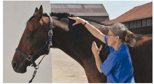
► Abb. 7.4 Mobilisation der Halswirbelsäule links (Traktion kombiniert mit Muskelrelease).

Ein tiefes Hineinschieben der Therapiehand Richtung ventro-kaudal zwischen Buggelenk und Sternumspitze sowie ein gleichzeitiges Herüberschieben des Mähnenkamms über C6 bewirken