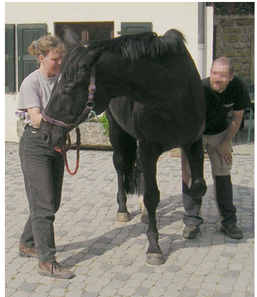
► Abb. 7.6 Bei der Dehnungsmobilisation der linken Halsbasis ist viel Feingefühl nötig.