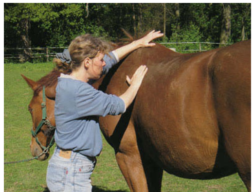
► Abb. 7.7 Mobilisation des Kostotransversalgelenks T9 links.

Eine optimal effektive Facettengelenks- und Rippengelenksseparation erhält man durch folgenden Handgriff (► Abb. 7.8): Schmiegen Sie Ihren Unterarm um die Gurtlage am Bauch an, drehen Sie den