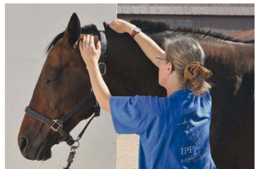
► Abb. 7.2 Mobilisationsbeispiel der Kopfgelenke links (Traktion Okziput links nach rostral, Traktion Axis nach dorso-kontralateral).

Es empfiehlt sich, dem Kopfgelenksbereich zunächst mit sanfter Massage zu vermehrter Durchblutung und zur Lockerung zu verhelfen. Ausgerechnet betroffene Pferde, die Schmerzen in den