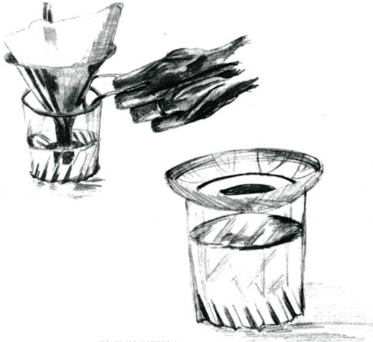
Kochendwasser in ein sauberes Glas filtrieren