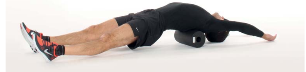
Diese Position kann auch ohne Rollbewegung als Dehnposition eingenommen werden.