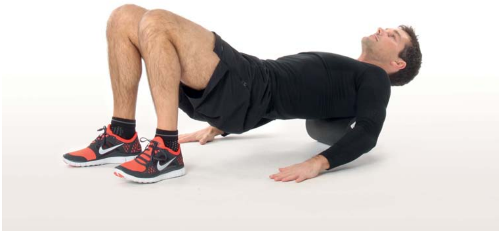
Ausgangsposition parallel zum Boden

Überhaupt ist das Ausrollen der Brustwirbelsäulenregion sehr anspruchsvoll und kann alternativ auch stehend an einer Wand ausgeführt werden. Dabei wird die Rolle zwischen Brustwirbelsäule und Wand eingeklemmt, die Beine strecken und beugen den Körper langsam.