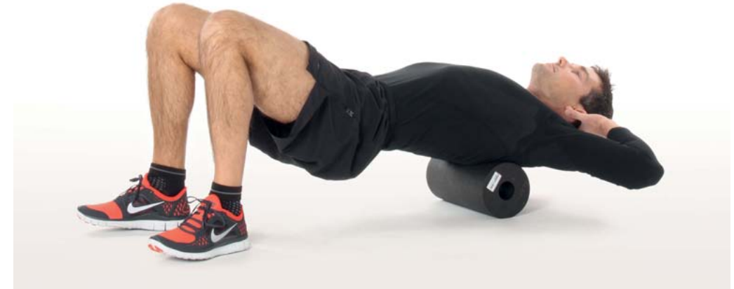
Intensivere Variante mit Armen im Nacken