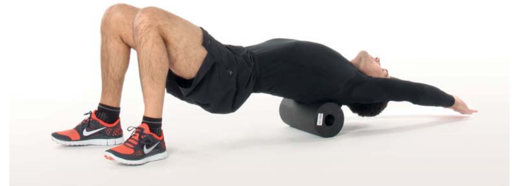
Sehr intensive Variante mit gestreckten Armen