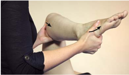
► Abb. 11.5 Behandlung der Fibula kranial.

Der Daumen der kranialen Hand mobilisiert das Fibulaköpfchen sanft nach kaudal (► Abb. 11.5). Zeitgleich wird der Fuß immer weiter in eine Supinationsstellung gebracht, um so über die Bänder die Fibula nach kaudal zu ziehen, bis sie ihren physiologischen Stand zurückgewonnen hat.