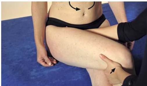
► Abb. 11.3 Behandlung des Lig. iliofemorale – Kapselmuster Hüfte.

Vorgehen Die Hand kontralateral zu der behandelnden Seite in der Leiste so weit wie möglich Richtung Collum-Diaphysenwinkel an den Hüftknochen platzieren. Die homolaterale Hand liegt am Knie des zu therapierenden Beins. Das Bein so weit wie möglich in Adduktion und Innenrotation bringen (► Abb. 11.3). Die Leistenhand versucht, sich so tief wie möglich im Gewebe Richtung Knochen und Bänder zu platzieren, Schub nach lateral-posterior auszuüben und damit ein neues „Fulcrum“ zu setzen.