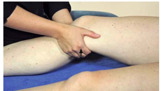
► Abb. 11.4 Behandlung der Fascia poplitea.

Vorgehen Die Fingerkuppen beider Hände werden in der Kniekehle platziert und palpieren langsam in Richtung anterior in die Tiefe des Gewebes (► Abb. 11.4).