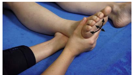
► Abb. 11.13 Behandlung des oberen und unteren Sprunggelenks nach Supinationstrauma.

Vorgehen Eine Hand wird in Höhe der Malleolengabel aufgelegt, die andere Hand umgreift den Fuß von plantar (► Abb. 11.13). Das Gewebe zwischen den Händen wird in seiner Gesamtheit anzeigen, wo es hin möchte. Der Therapeut ist lediglich behilflich, diese Positionen passiv mit einzustellen. Möchte der Fuß in eine Supinationsstellung, so hilft der Therapeut ihm, sich dort hinzubewegen. Als nächstes könnte eine Plantarflexion dazukommen, der man wieder behilflich ist usw. Je nachdem, wie groß das Trauma war und wie viele Strukturen beteiligt daran waren, muss der Therapeut eventuell neue Auflagepositionen für seine Hände einnehmen (z.B. Richtung Fibulaköpfchen oder Becken), um den Strukturen zu helfen, sich in der Traumaposition einzustellen. Diese Prozedur wird so lange verfolgt, bis alle beteiligten Strukturen in der Traumaposition verweilen und das Release stattfinden kann.