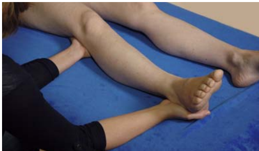
► Abb. 11.12 Behandlung der Achillessehne.

Vorgehen Eine Hand wird weich in die Kniekehle gelegt, die andere umfasst den Calcaneus (► Abb. 11.12). Mit beiden Händen wird durch Annäherung der Entspannungspunkt für die Fascia cruris und die Achillessehne zueinander gesucht.