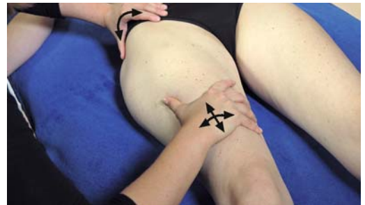
► Abb. 11.9 Behandlung des Hüftgelenks – Ilium zum Hüftkopf.