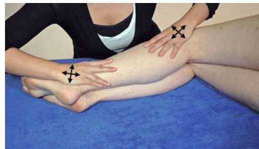
► Abb. 11.11 Behandlung Fibula kaudal.