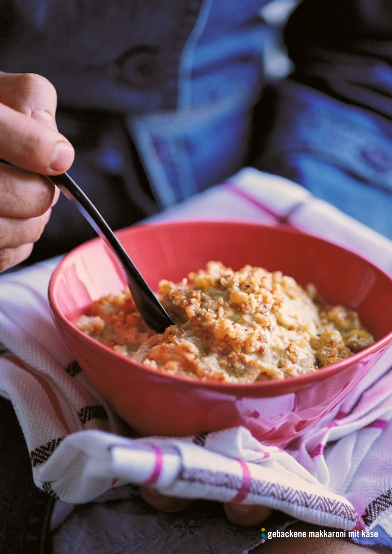
gebackene makkaroni mit käse