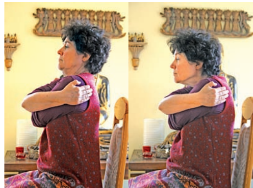
Abb. 98 und Abb. 99 „Vogel Strauß-Übung“