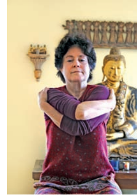
Abb. 97 „Grundhaltung“