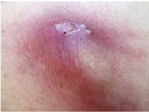
Abb. 45: Karbunkel

Durchmesser bis zu 13 cm oder mehr. Junge Personen oder solche mit robustem Naturell werden nur selten befallen. Beim Karbunkel treffen mehrere Furunkel und gangränöse Veränderungen aufeinander. Prädilektionsstellen sind die Haut entlang der Wirbelsäule, das Genick, inguinal und sternal. Karbunkel können bei abgemagerten und robusteren Menschen auftreten. Der Krankheitsverlauf steht meist mit großen Schmerzen in Verbindung.