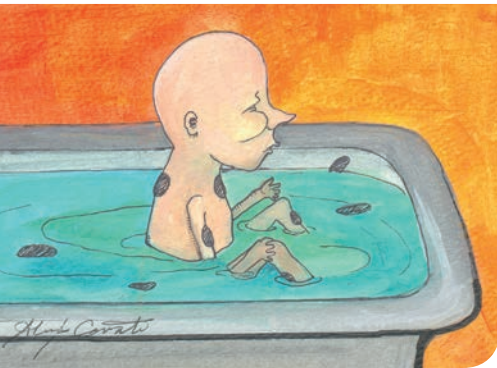
Aquarell von Lex Covato, New York

Meist beginnt man in der Kreuzbeinregion, weil diese sich am besten bewährt hat.