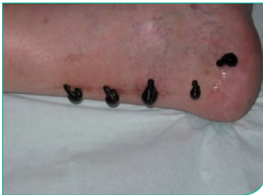
Ansetzen der Blutegel auf Verwachsungen nach einer Achillessehnen-Operation

Die Achillessehnenentzündung ist mit Blutegeln sehr gut behandelbar. Die Egel werden lokal angesetzt. In der Regel werden 4-8 Egel in das betroffene Gebiet gesetzt. Je nach Reaktion des Patienten kann es notwendig sein, die Behandlung mehrmals zu wiederholen.