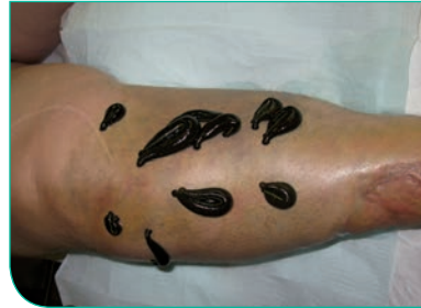
Behandlung eines Hämatoms nach Sturz

Auch Haustiere von Katze bis Pferd sind dankbare Blutegelpatienten. Wie beim Menschen werden Gelenkbeschwerden und Sehnenerkrankungen erfolgreich behandelt. Auch Bisswunden lassen sich meist ohne Antibiotika heilen. Bei Milchkühen gehen Euterentzündungen sehr schnell zurück und die Milch kann, da keine Medikamente benötigt werden, zügig für den Verzehr freigegeben werden.