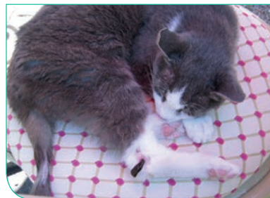
Behandlung einer Katze mit schmerzender Gelenkarthrose