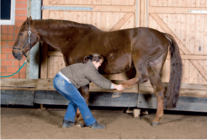
Abb. 8.6 Dehnung der langen Sitzbeinmuskeln.