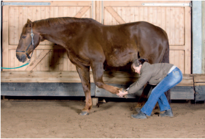
Abb. 8.4 Mobilisierung der Skapula-bewegenden Muskulatur.