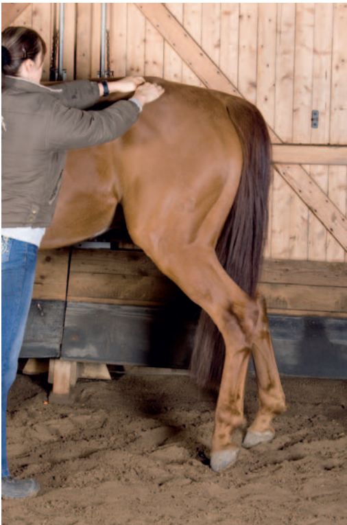
Abb. 8.5 Behandlung des Stresspunkts (SP) 15 nach Jack Meagher.

rende Wirkung. Der Stresspunkt SP 15 liegt am Übergang vom M. longissimus dorsi zum M. gluteus superficialis (Abb. 8.5) und erweist sich neben anderen als sehr wirkungsvoll für das Heimprogramm.